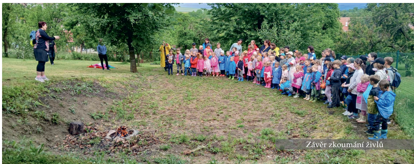
Závěr zkoumání živlů