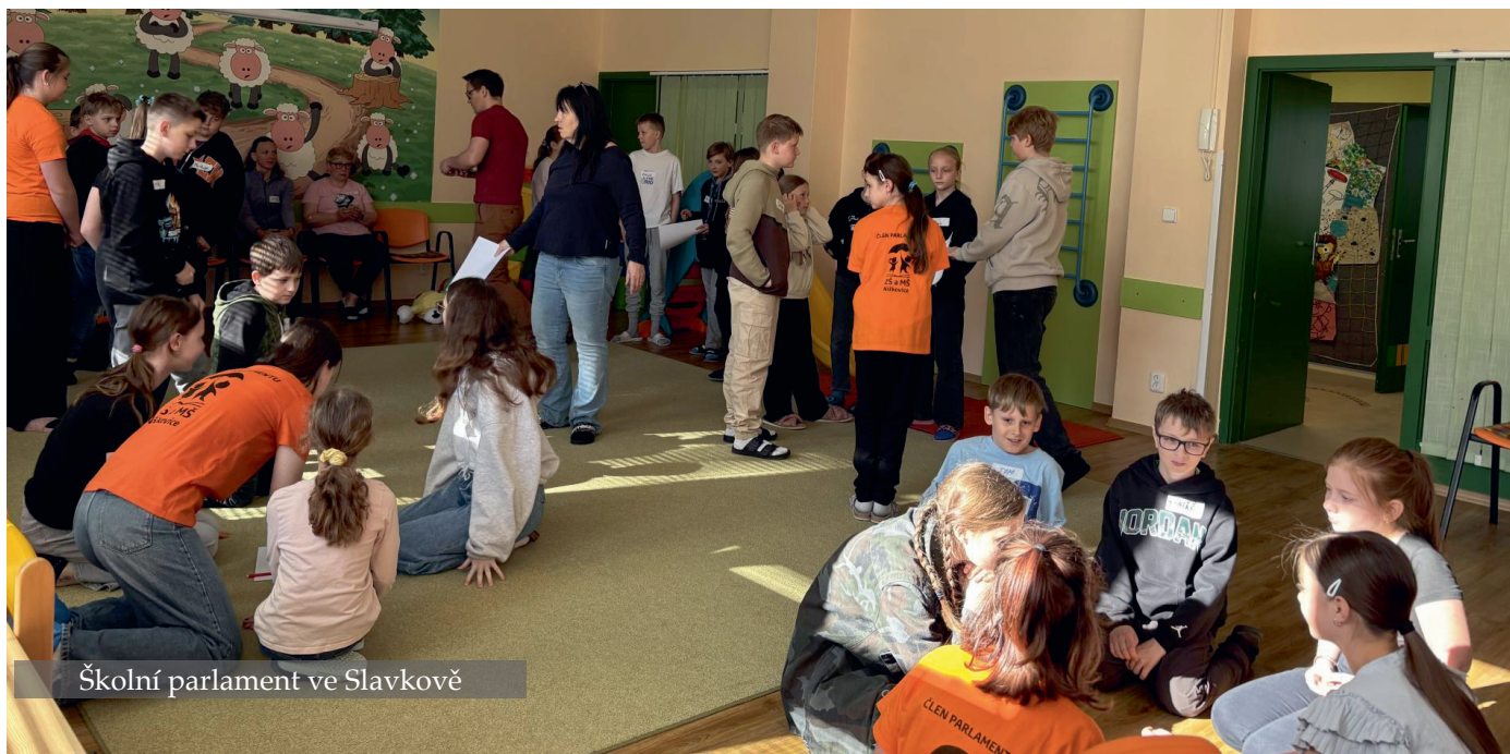
Školní parlament ve Slavkově