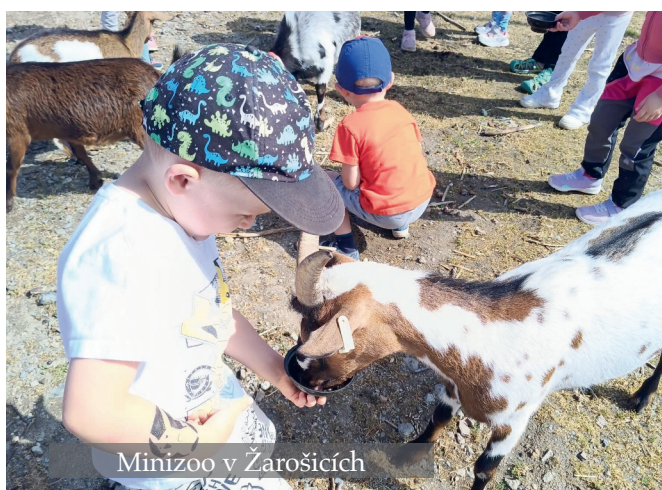
Minizoo v Žarošicích

V úterý 2. června 2026 prožily i mladší děti Kuklínici a Housenečky z Mateřské školy krásné dopoledne plné zvířátek. Společně jsme se vydali na výlet do nedaleké Minifarmy Žarošice, kde na nás čekalo velké dobrodružství a spousta chlupatých i opeřených kamarádů.