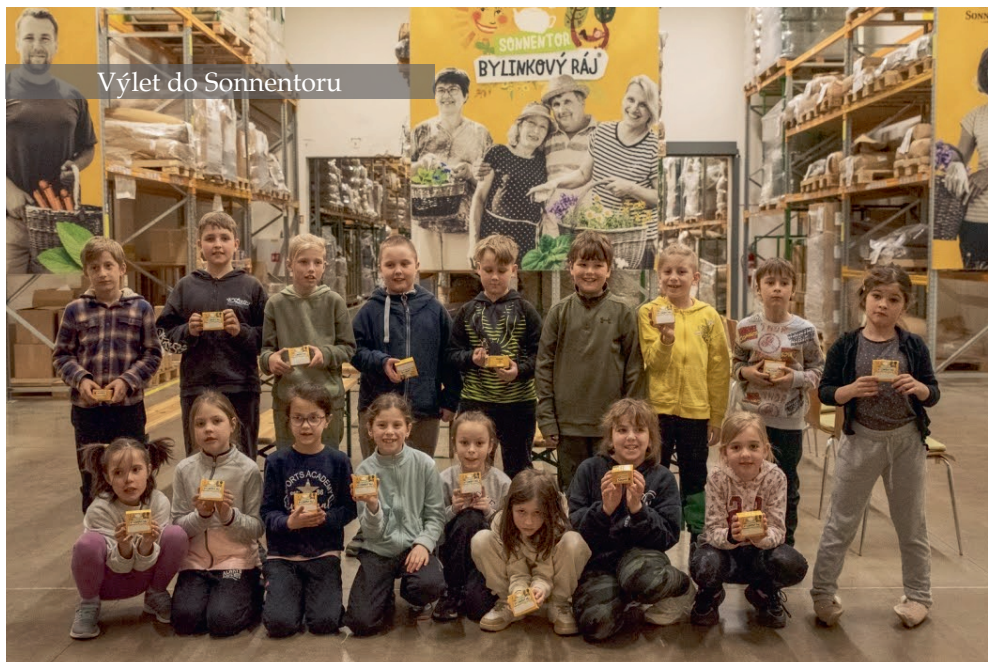
Výlet do Sonnentoru

Další akce, kterých jsme se zúčastnili, jsou například recitační soutěž v Kobeřicích, Den otevřených dveří ve škole ve Slavkově, Počítáme s papoušky, Čtenářská výzva – Čtenář a superčtenář Slavkovska.